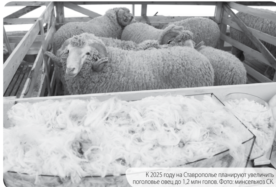
К 2025 году на Ставрополье планируют увеличить поголовье овец до 1,2 млн голов.

Отметим, что к 2025 году в крае планируют увеличить поголовье овец до 1,2 млн голов, нарастив производство шерсти до 7 тысяч тонн в год.